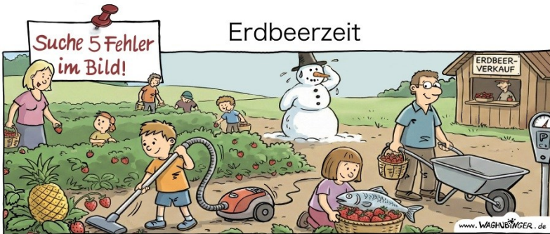
Ananas, Staubsauger, Schneemann, Fisch, Parkuhr